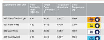
Light colors, color rendering properties and Light Color Coordinates for OSRAM DULUX® - lamps with integrated control gear

1) Datenname | DRG CODE | Initials Technikentwicklung | TTB0101101